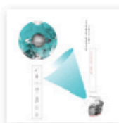
Victoire chose (Teenage Menopause) // 2019.

C'est le label Transcachette qui réalise ces propres jaquettes et qui veut pour leur couverture un portrait du musicien ou de la musicienne. C'est la ligne éditoriale. Pour ma part, je n'avais pas spécialement envie d'une photo de moi et le seul moyen qu'on a trouvé, c'était de me mettre en tant que figure, de me casser en deux comme une statue et de me positionner dans un livre, dans