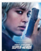
Comment je suis devenue super-héros Netflix // 2021.

Je n'ai pas encore vu le film, mais tout le monde dit que c'est un chef d'œuvre, j'ai envie de dire Youpi! C'est un western de science-fiction en couleur. After Blue est le nom d'une explosion sur laquelle il n'y a que des femmes et nous sommes toutes