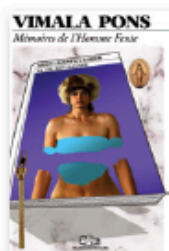
Mémoires de l'Homme Fente (Transcachette Tapes) K7 (7€) & Digital (6€) // 2020.