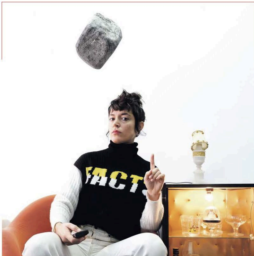
Vimala Pons, figure facétieuse du cirque contemporain.